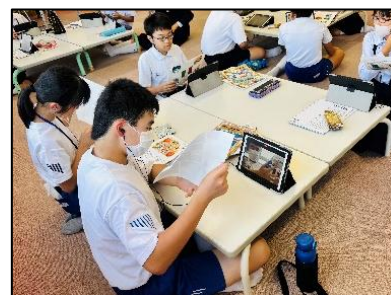
〈図3 自己モニタリングをしている様子〉

My Goal 達成に向けて自らの学び方と成長を確かめながら学びを進め、成長の自覚や達成感を得るためには、目標とする姿と現状との比較を行うことが欠かせない。しかし、自らの現状を客観的に捉えられていないという課題があった。そこで、自分の成長や達成感を自覚できるように、タブレット端末の録画機能を使って、自らが話している様子を録画・視聴し、学びの成果を振り返る機会を設定する。例えば、自らの英語表現を発表している姿を録画したものを視聴し(図3)、My Goal 達成に向けて、目標とする姿と現状との比較をし、自らの現状や成長について、振り返りシート等に記述する機会を設定する。また、振り返りをもとに、友達や教師からの感想や助言を得ることで、自らが気づきにくい成長について、自覚を深めることにつながると思う。ただし、機会の有無や回数は、子どもたちの実態、必要感に応じて、調整していく。そうして、「自分はできる」「努力すればできる」という「自信」を深めることにつながると思う。